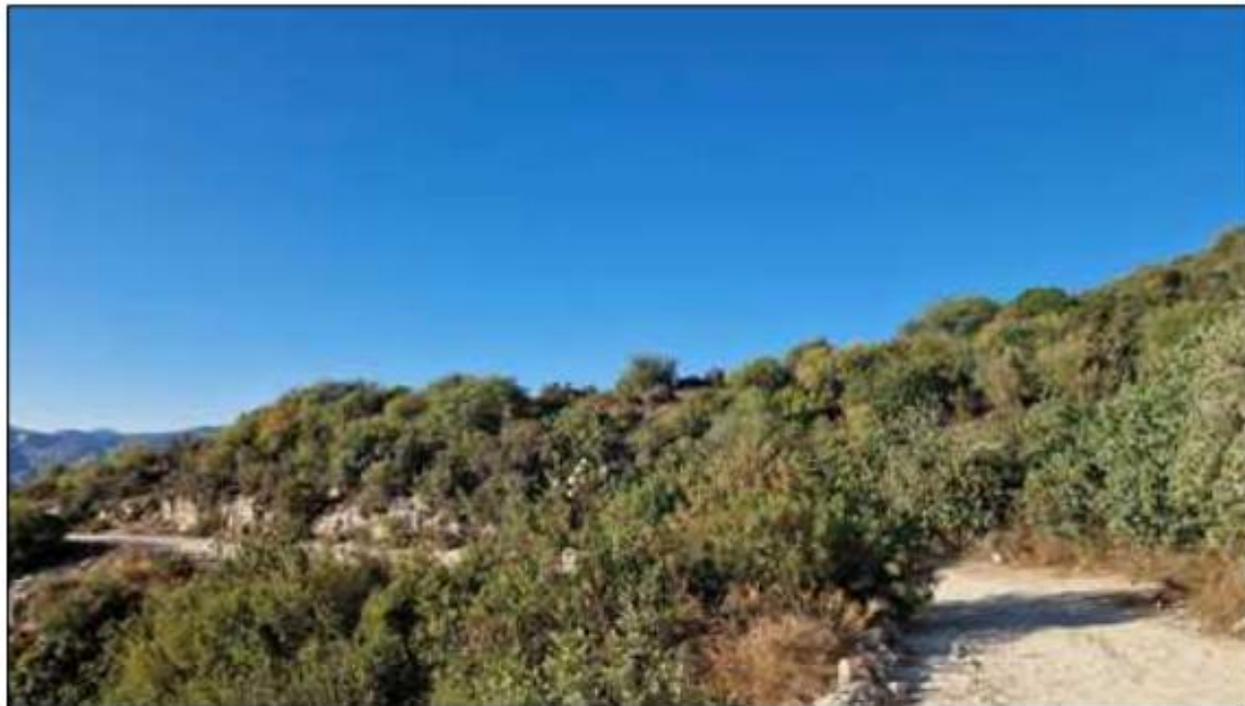
Εξεταζόμενο ακίνητο (III), τεμ. 20