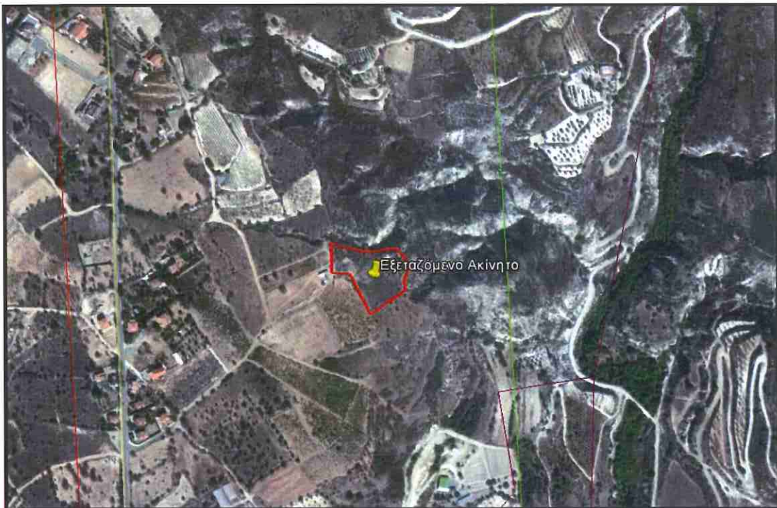
Πηγή: Αεροφωτογραφία της άμεσης περιοχής των ακινήτων, δεν είναι σε κλίμακα και ούτε πρόσφατα ενημερωμένη (Google Earth).