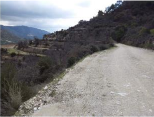
Μέρος των πετρώσεων 307 και 309.