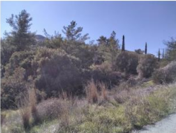
Μέρος του πετρώσιου 30.