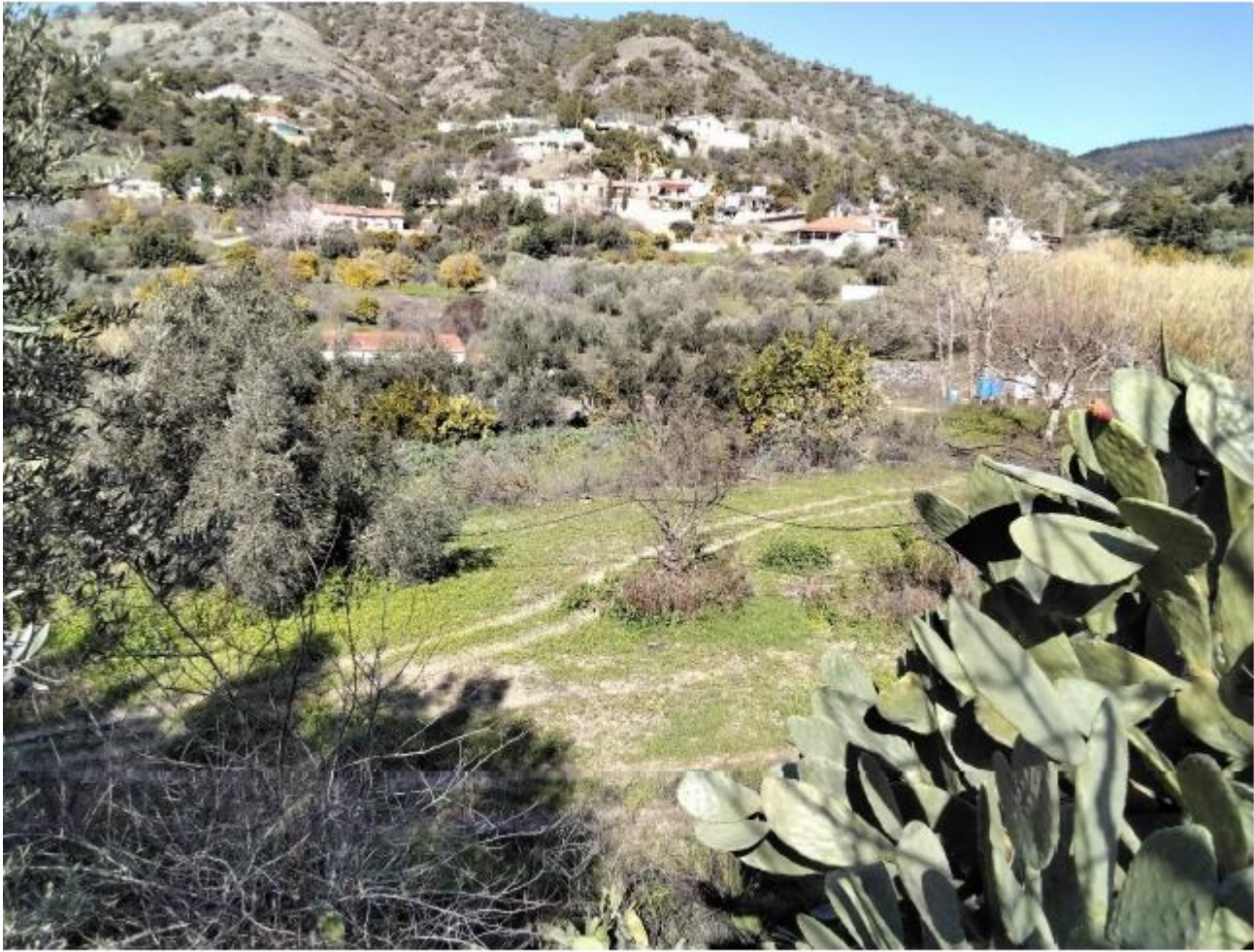
Μέρος του τεμαχίου 1163.