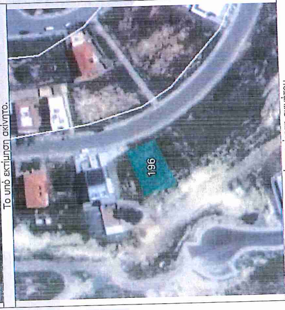
Το υπό εκτίμηση ακίνητο.