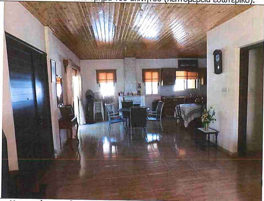
Η κατοικία στο νότιο τμήμα του ακινήτου (λεπτομέρεια εσωτερικό)..