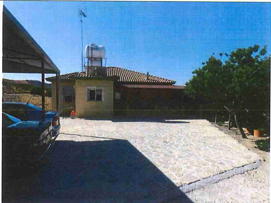
Η κατοικία στο νότιο τμήμα του ακινήτου.