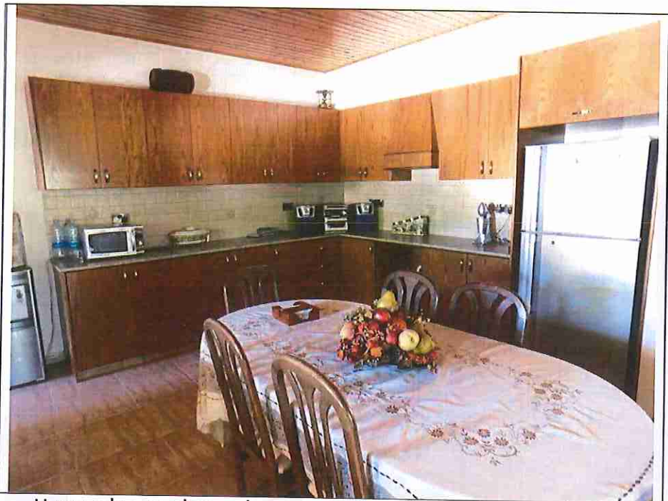
Η κατοικία στο νότιο τμήμα του ακινήτου (λεπτομέρεια εσωτερικό).