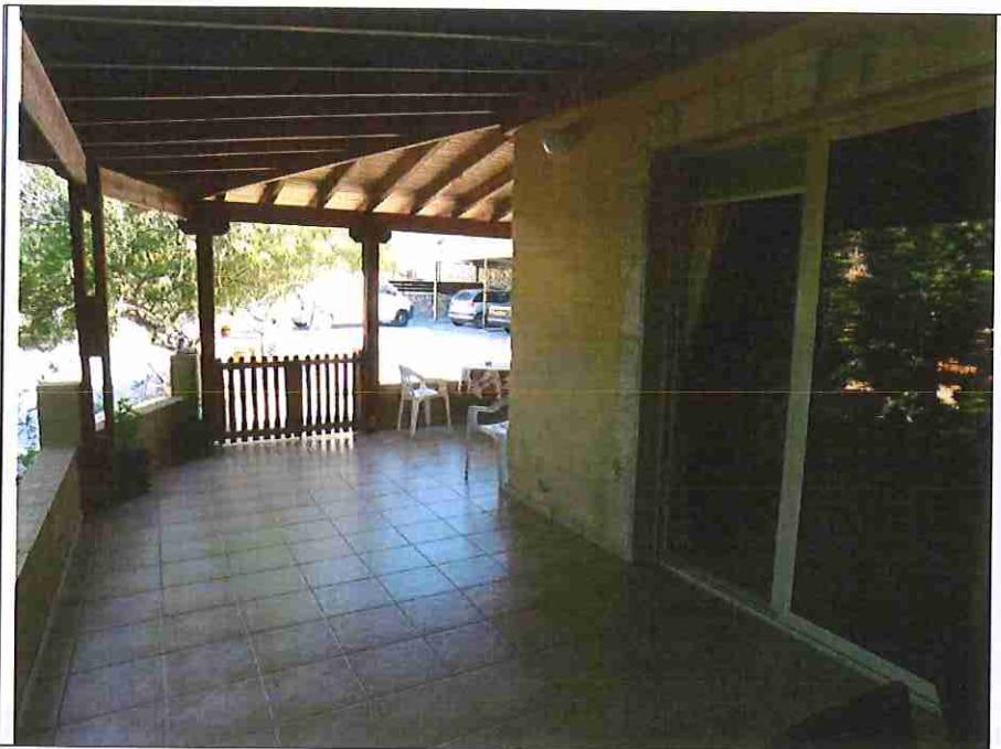
Η υπό εκτίμηση κατοικία (λεπτομέρεια καλυμμένη βεράντα).