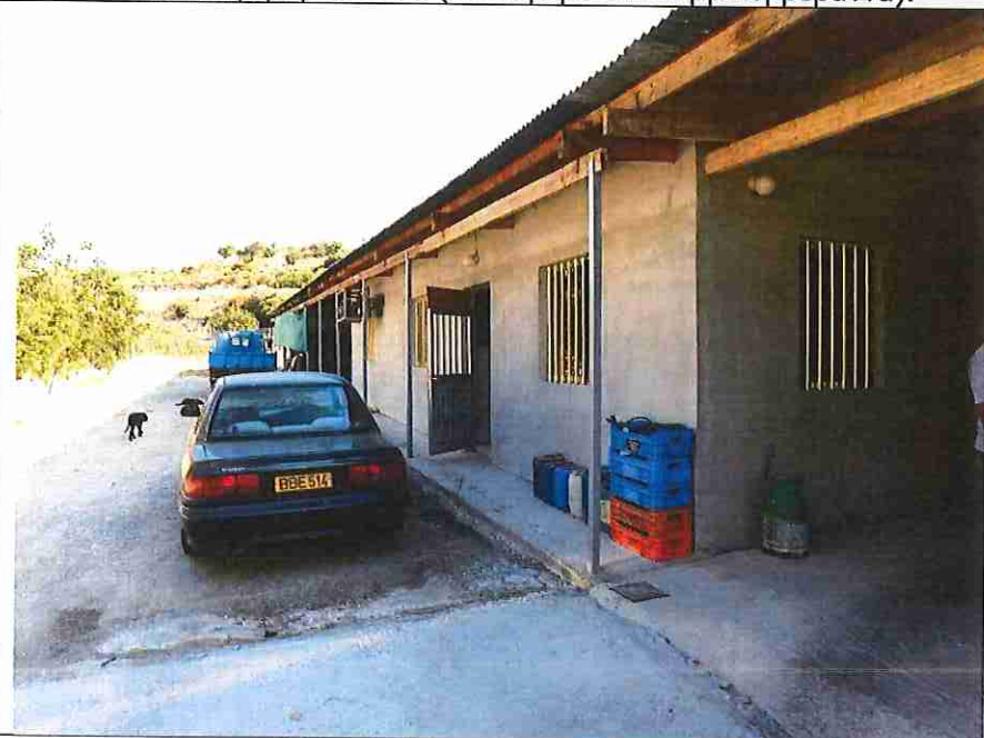
Μονάδα εκτροφής πουλερικών και σφαγείο