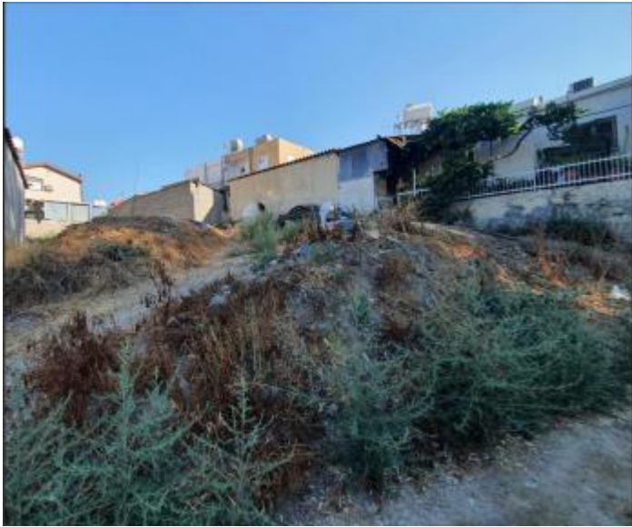
Αριθμός Εγγραφής 1/54