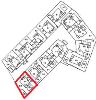
Κλίμακα 1 : 1000