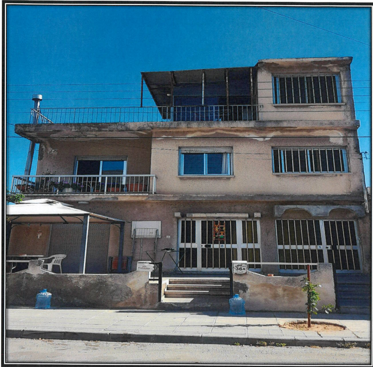
ΠΑΡΑΡΤΗΜΑ 2: Φωτογραφία Ακινήτου