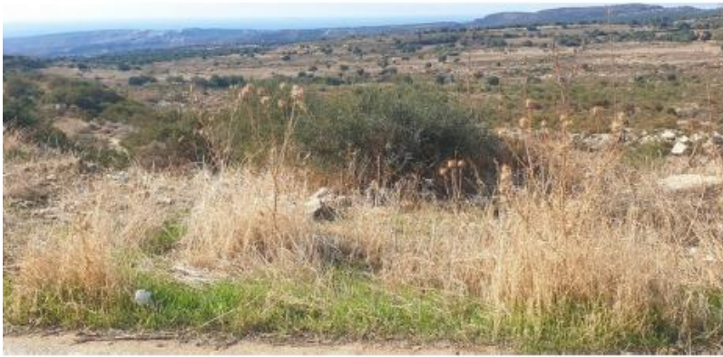
Φ./Σχ. 52/23 αρ. τεμ. 360 Ανώγειρα