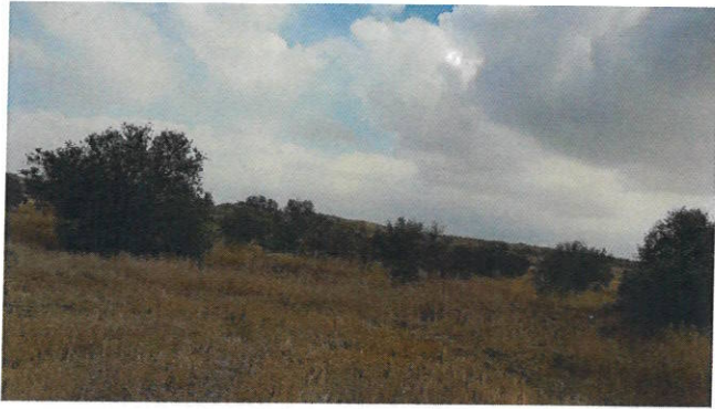
TEMAXIA 53 & 54