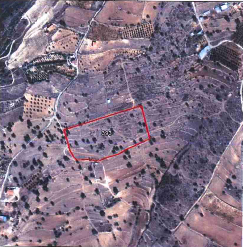
Δορυφορική απεικόνιση τεμαχίου.