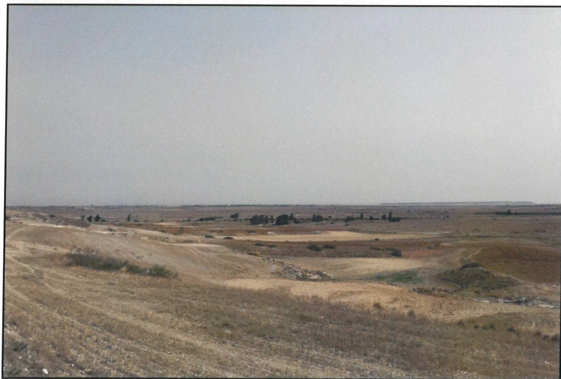
Ακίνητα (α, β & γ)