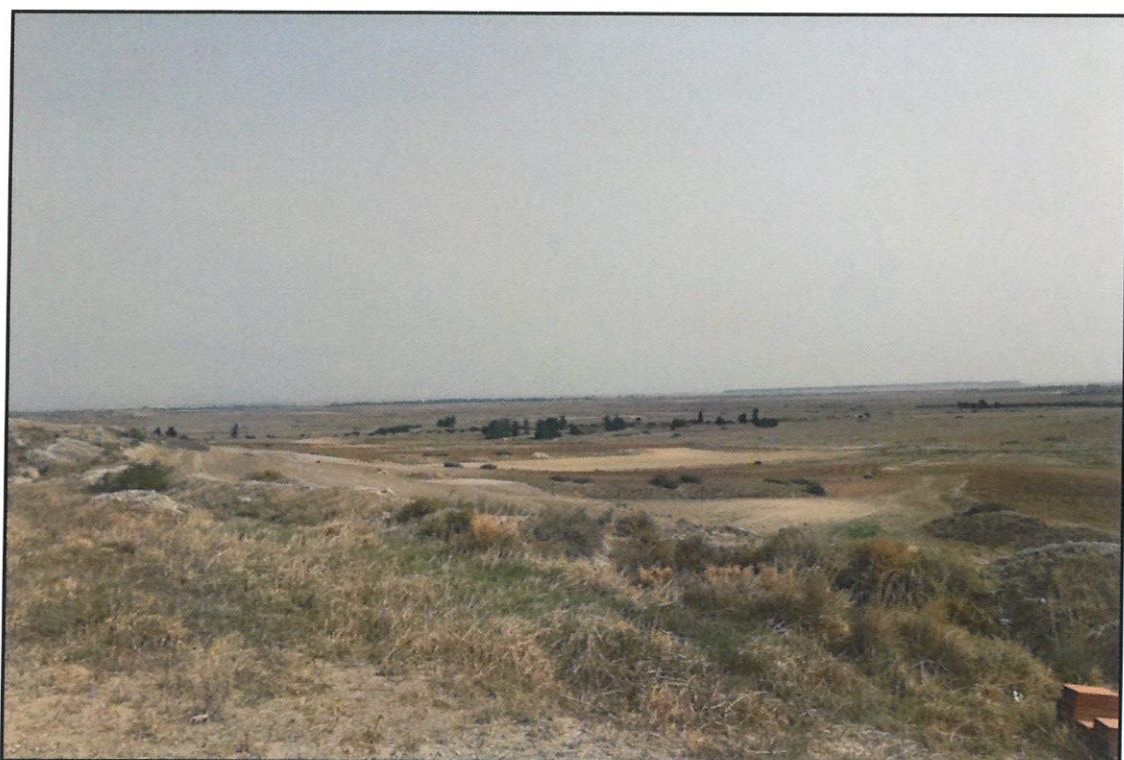
Ακίνητα (α, β & γ)