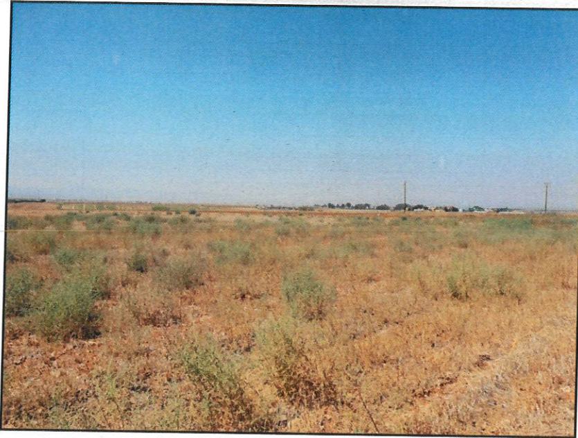
Ακίνητο 4 [Αρ. Τεμαχίου 489]