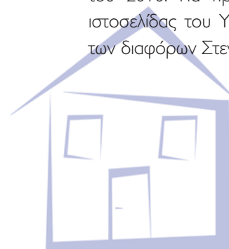
Νεοκλής Συλικιώτης Υπουργός Εσωτερικών

Στις επόμενες σελίδες αυτού του ενημερωτικού εντύπου, το οποίο εκδίδεται για δεύτερη φορά, θα ενημερωθείτε για τις βελτιώσεις που επιφέραμε στα διάφορα Στεγαστικά Σχέδια μέσα στο δεύτερο εξάμηνο του 2010. Για πρώτη φορά δίνεται, επίσης, πρόσβαση μέσω της ιστοσελίδας του Υπουργείου Εσωτερικών, στις λεπτομερείς πρόνοιες των διαφόρων Στεγαστικών Σχεδίων.