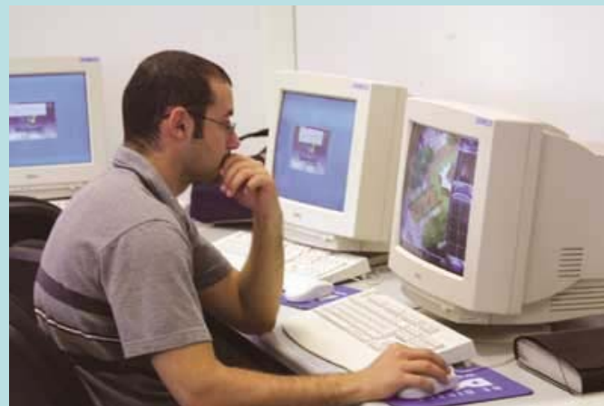
Φωτο. Πανεπιστήμιο Κύπρου