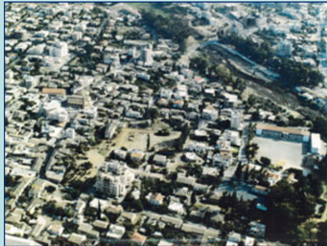
Φωτο. Δήμος Στροβόλου (κάτω)