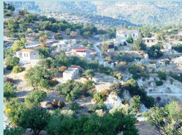
Φωτο. Ατλαντίς Συμβουλευτική Κύπρου (πάνω)